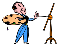
(paint a picture)